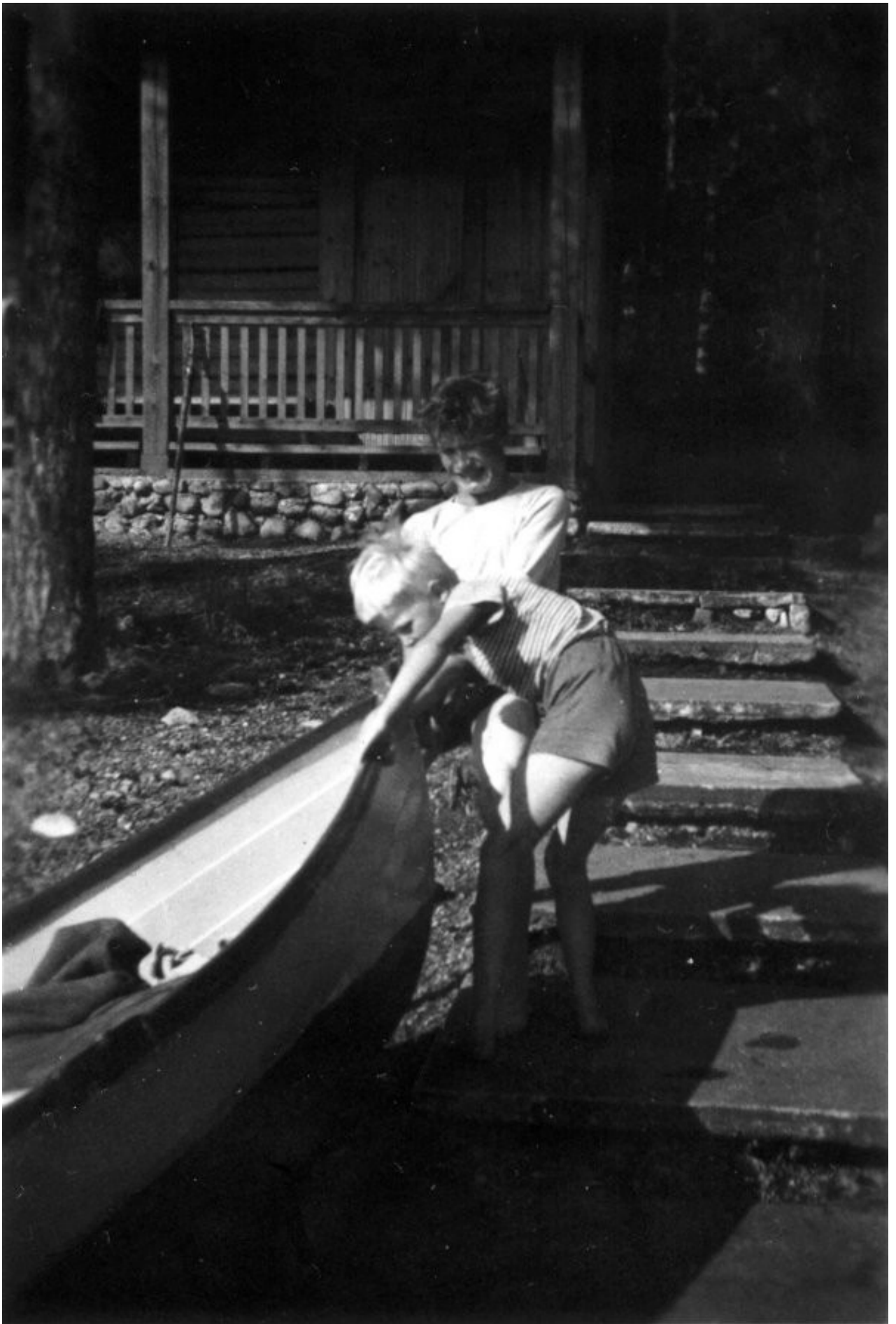
Masteensaarella (pinta-ala noin 80 hehtaaria) sijaitsee mökki, jota rauhalaiset saattoivat varata päiväksi. Siellä oli isokokoinen tupa, ja rantsauna, jonka näet ylläolevassa kuvassa. Siinä minä ja velivainajani vedämme venettä maihin. Tämä kuvan rantsauna näyttää tänään täsmälleen samanlaiselta kuin ennen. Masteensaari sijaitsee Tiuruniemen kärjen kohdalla, ja lähellä manteretta sijaitsee jutussa mainittu